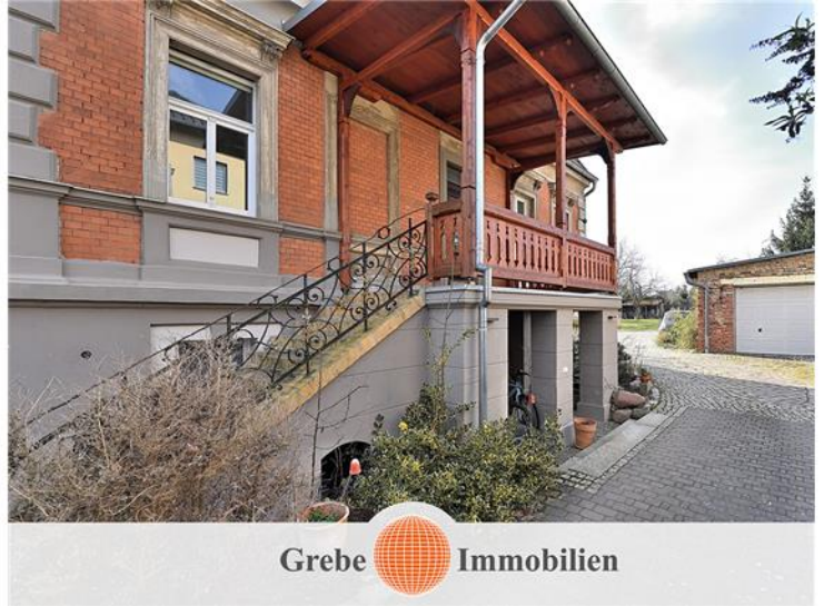
Treppe zur Veranda