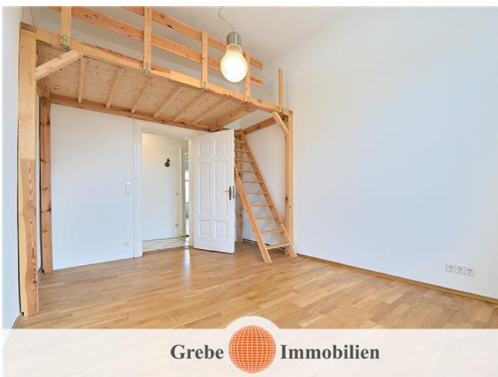
Zimmer 4, Bild 2