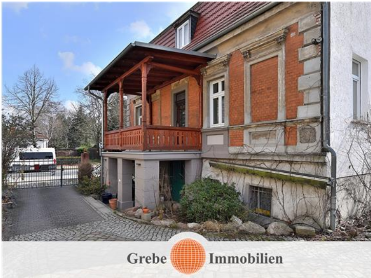
Zufahrt zum Grundstück