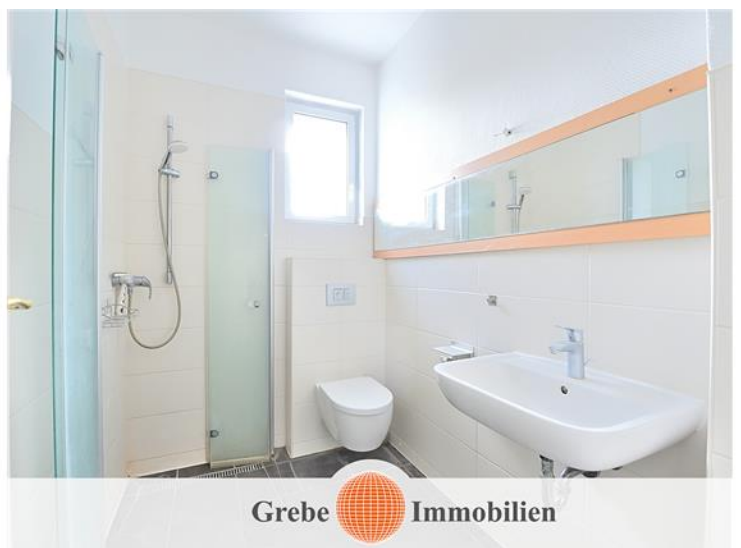
Badezimmer mit Fenster