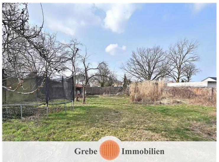
großer und ruhiger Garten