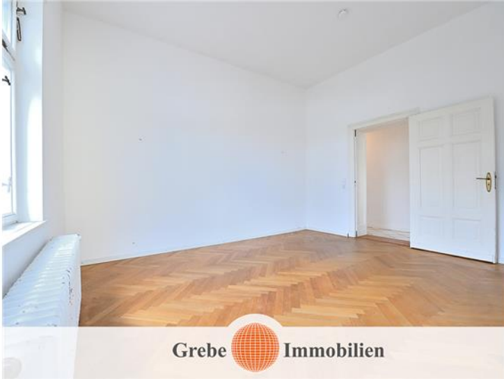
Zimmer 2, Bild 2