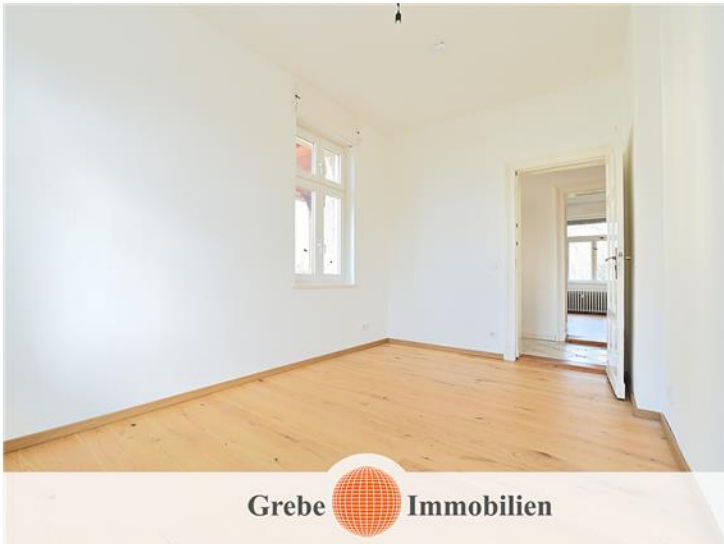
Zimmer 3, Bild 2